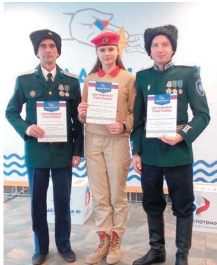
Региональный этап VI Всероссийского конкурса «Делай, как я!» пройдёт уже осенью.

В течение конкурсных дней ей предстояло пройти несколько этапов: самопрезентацию, тестирование и соревнования по физической и военно-прикладной подготовке.