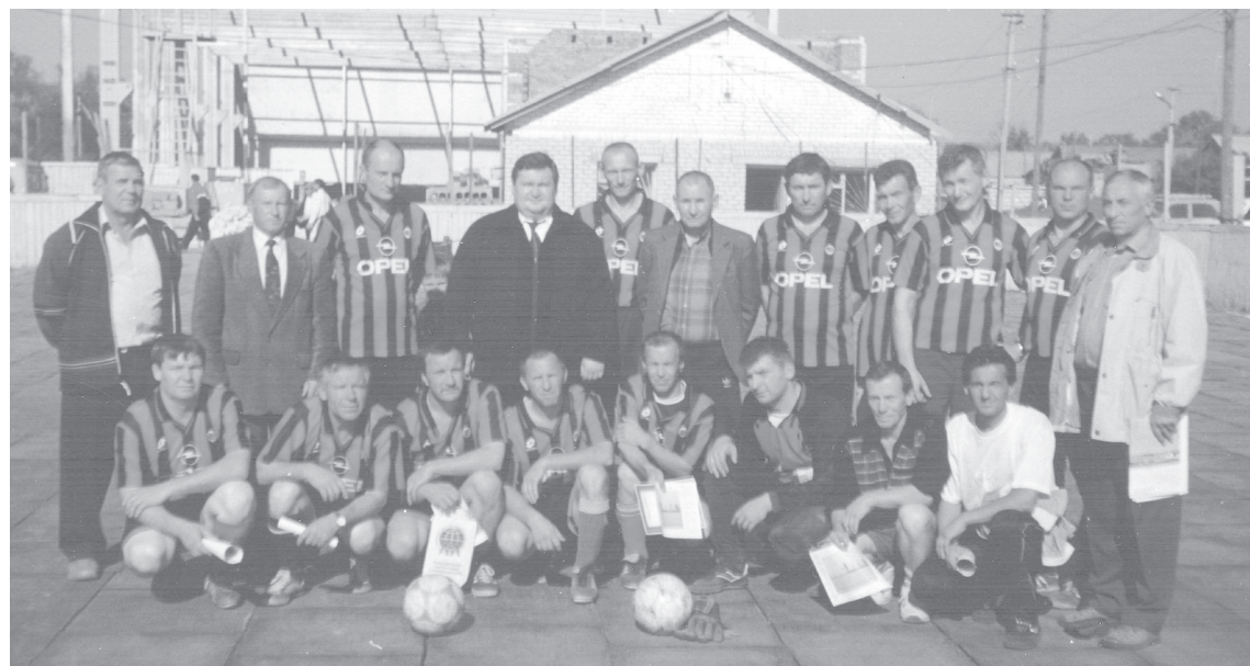
Футбольная команда Новосергиевки