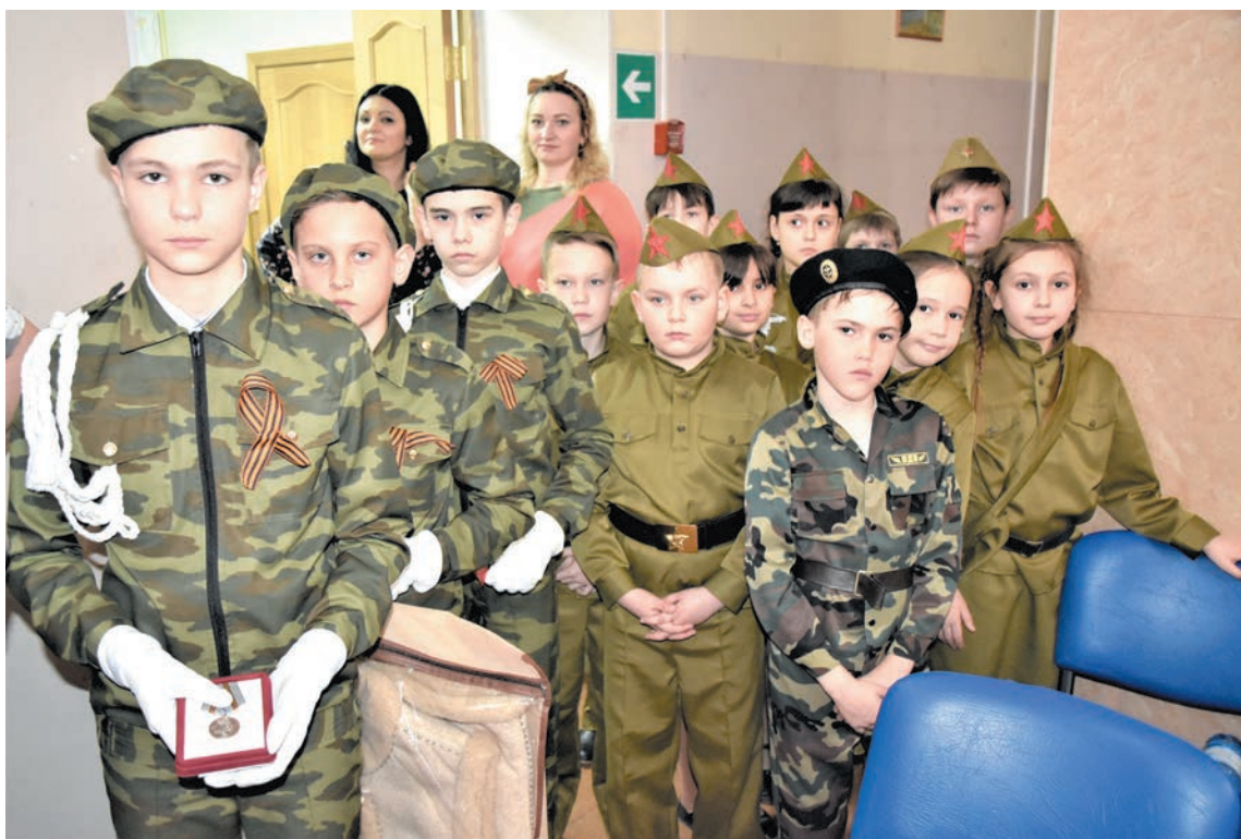
Будущие защитники Отечества

Кристина НЕЧАЕВА Оренбургский район