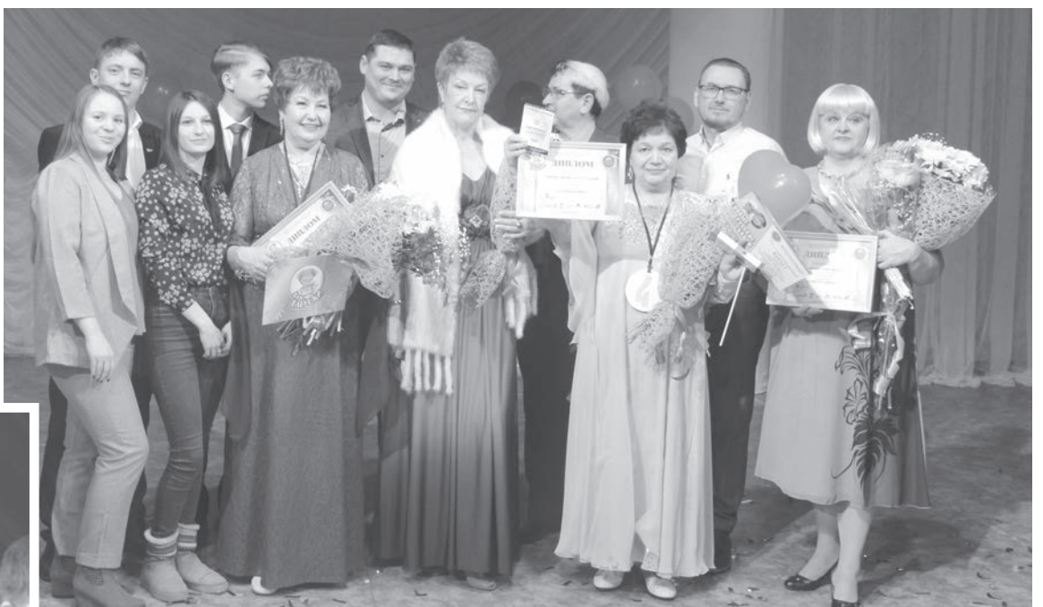
Конкурсантки с заслуженными наградами