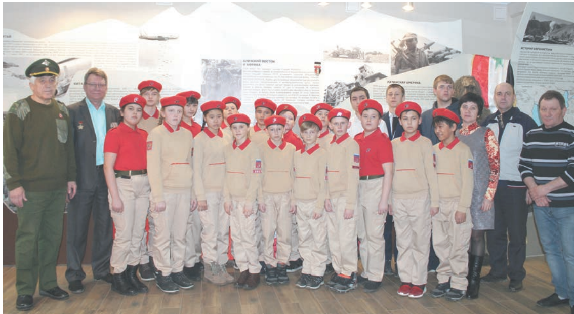
Детям запомнилось посещение музея

Ребята из села Буланово с удовольствием постреляли в электронном тире, поддержали в руках автомат Калашникова и пистолет Макарова