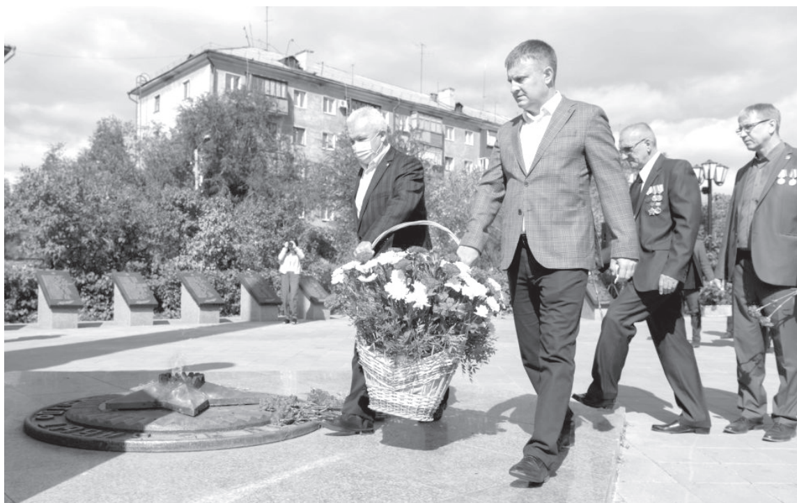
Новотройчане отдали дань памяти участникам Второй мировой войны