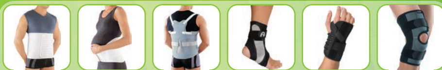
Бандажи, корсеты и ортезы

«Оренбургский салон-магазин» филиал федерального государственного унитарного предприятия «Московское протезно-ортопедическое предприятие» Министерства труда и социальной защиты Российской Федерации МЫ РЕАЛИЗУЕМ ШИРОКУЮ ГАММУ ТЕХНИЧЕСКИХ СРЕДСТВ ДЛЯ РЕАБИЛИТАЦИИ