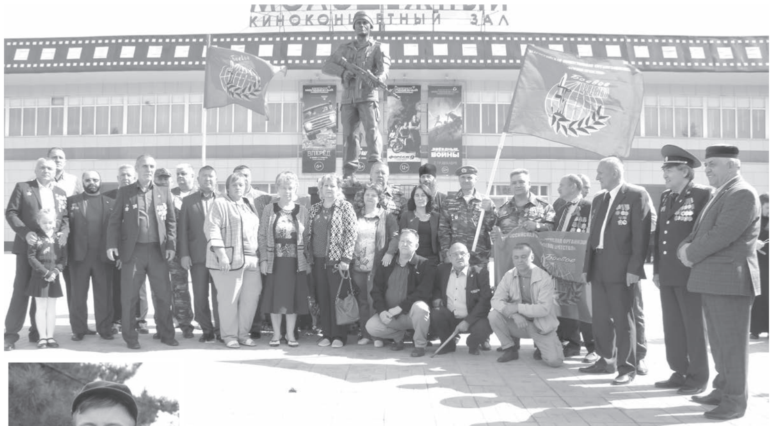
Подвиг Героя навеки останется в наших сердцах

В городе Новотроицке на площади перед Молодёжным центром рядом с улицей, с которой ушёл Константин Ситкин в свой последний бой, установлен памятник Герою