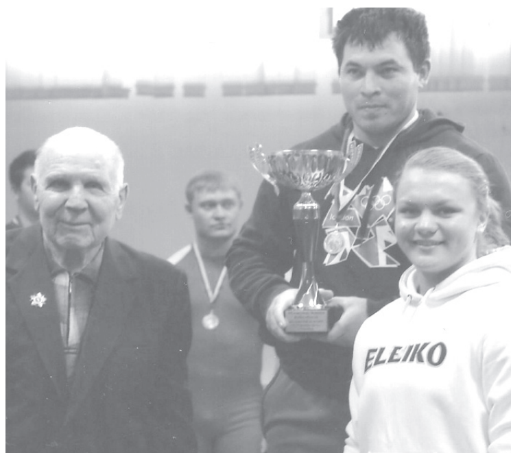
Тренер вручает награды победителям