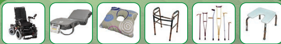
Современные средства реабилитации, противопролежневые системы, подушки, матрасы