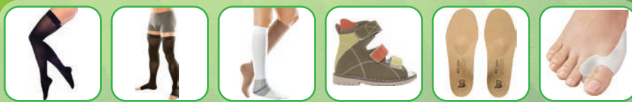
Медицинский компрессионный трикотаж (колготки, чулки, гольфы), ортопедическая обувь, стельки, приспособление для стоп