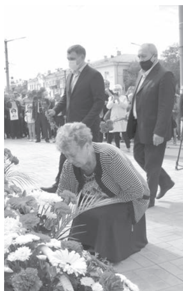
Мама часто приходит к сыну