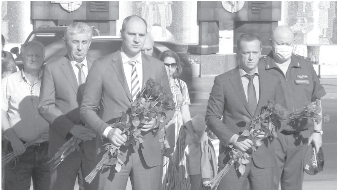
На возложении у мемориала «Вечный огонь» в Оренбурге

3 сентября в России отметили день окончания Второй мировой войны