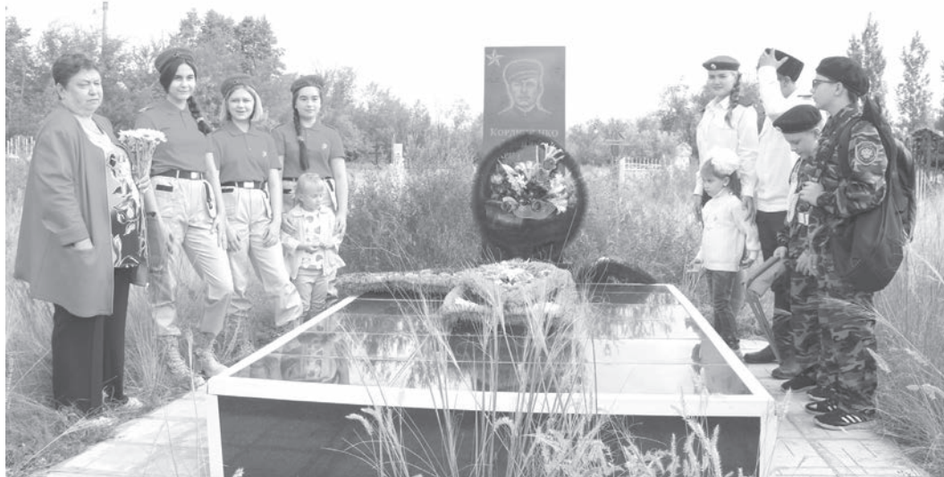
У могилы красноармейца

Победа досталась Красной Армии дорогой ценой. Это сражение стало одним из самых кровопролитных в Великой Отечественной. Гитлер и его окружение понимали, что если и удастся переломить победное шествие войск Советского Союза, то только на Днепре, и к этому готовились. К началу