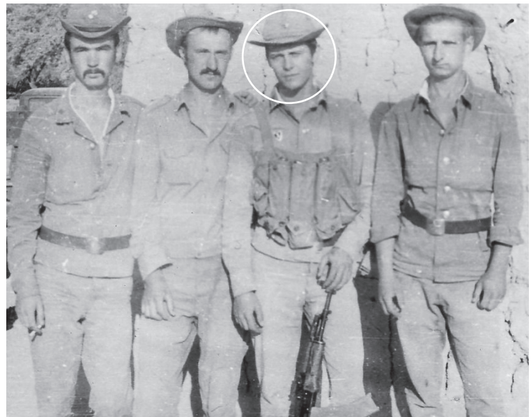
Афганистан. 1984 г.

Он сам горел и всех вокруг себя заряжал позитивом.