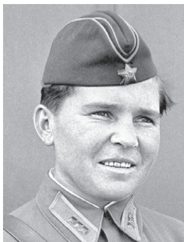
Полина Денисовна Осипенко