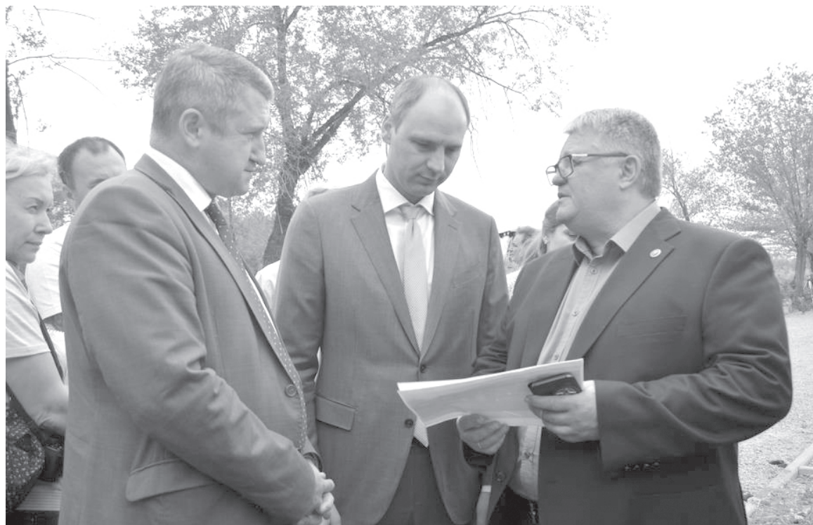
Отстаивая интересы соратников