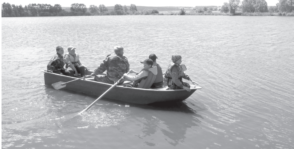
На занятиях по шлюпочному делу