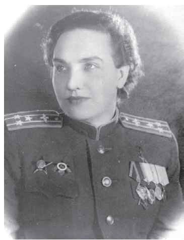
Валентина Степановна Гризодубова

В ноябре 1938 года первым женщинам в СССР присвоено звание Героя Советского Союза