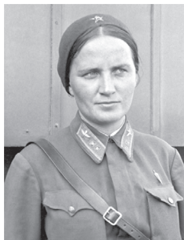
Марина Михайловна Раскова

Союз. Рано или поздно их жизненные пути должны были пересечься.