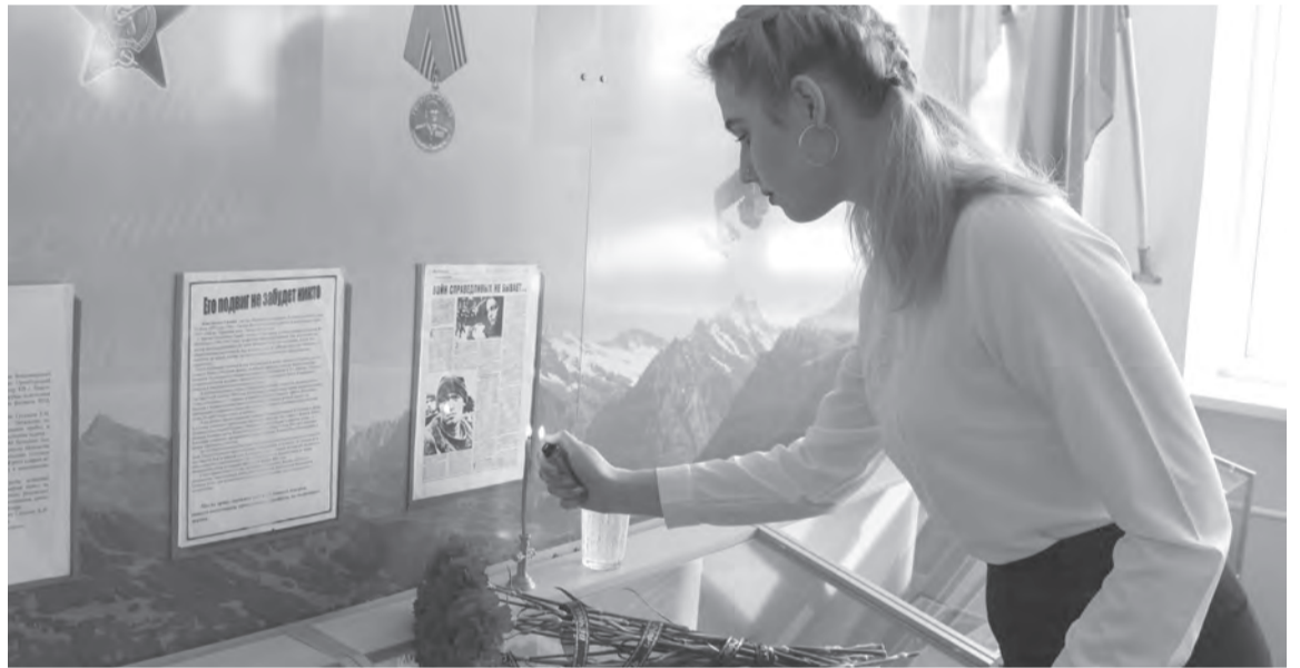
Свеча памяти в школе №17

Командир взвода шёл в бой впереди своих солдат, показывая пример мужества и отваги. Лично уничтожил две огневые точки и снайпера боевиков. За