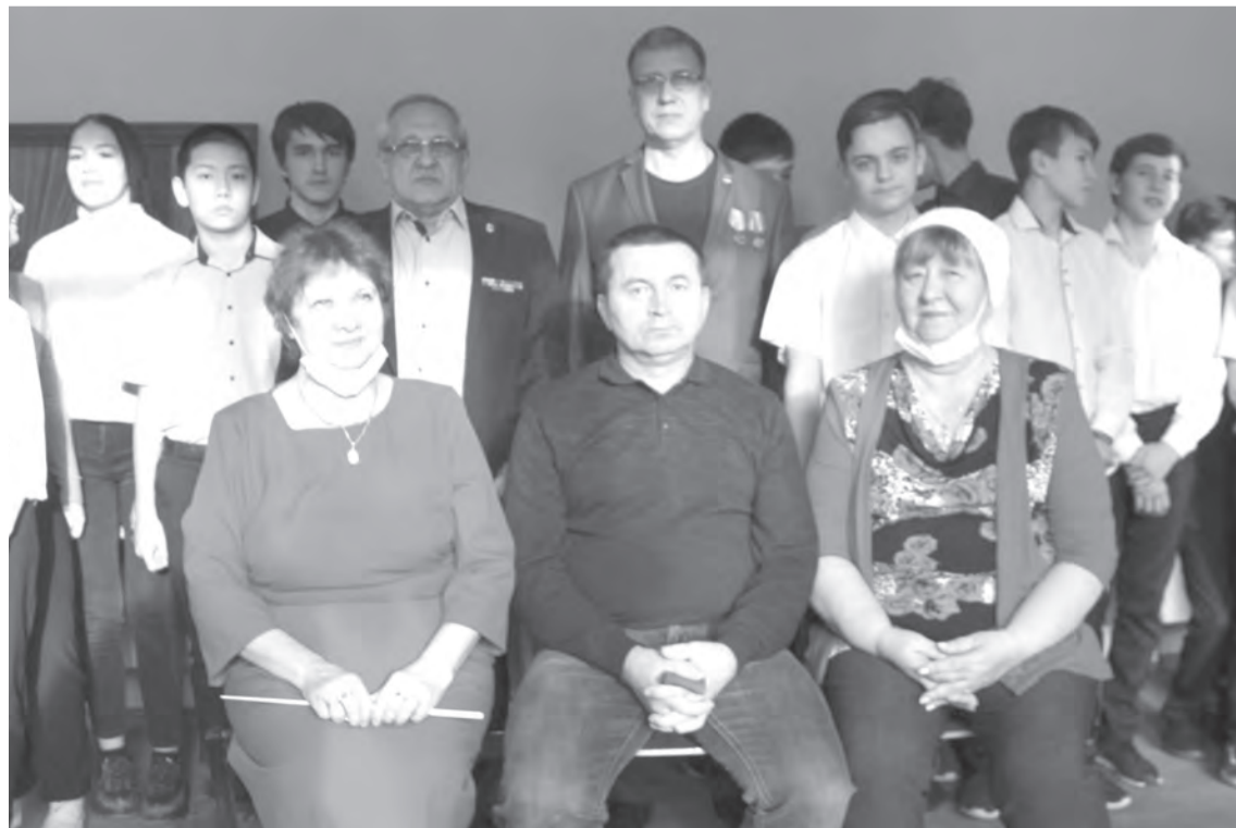
В гостях у ребят – ветераны боевых действий

которые, мы продвигались к цели наших поисков. Когда находили – радости не было пределов. Мне было 11 лет, когда его не стало. Как мне его не хватало всю жизнь.