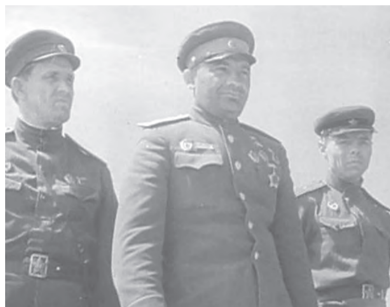
В центре Герой Советского Союза, генерал армии Яков Крейзер