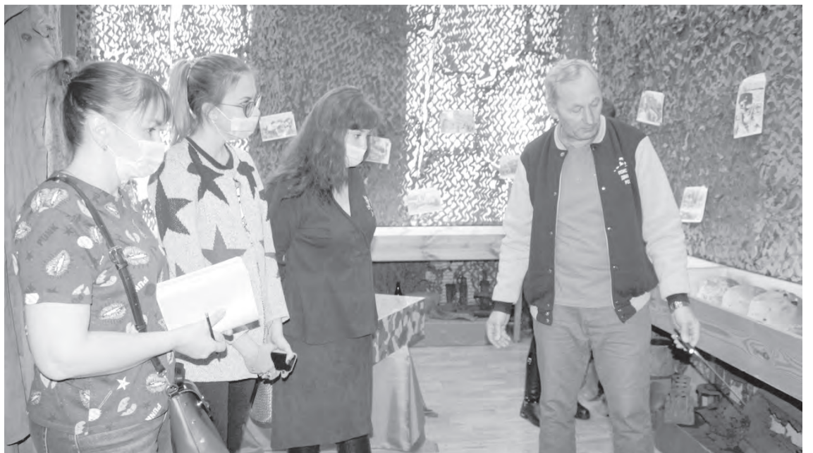
Первые посетители музея поискового движения по новому адресу