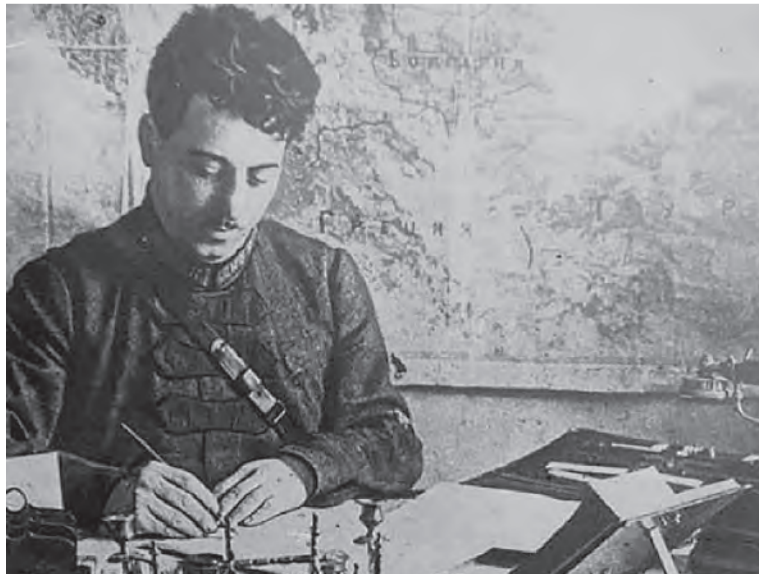
Гая Дмитриевич Гай

Красногвардейские отряды вошли в Оренбург под общим командованием Петра Кобозева в январе 1918 года. Но уже в июле город захватили дутовцы. А в январе 1919 их выбили.