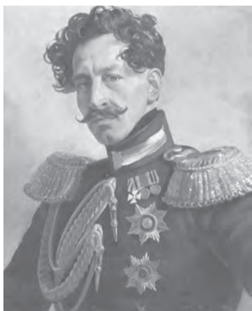
Василий Алексеевич Перовский

В истории Оренбурга, трижды зачатого и единожды рождённого, много кровавых страниц, в том числе и событий, происходивших в январе разных годов