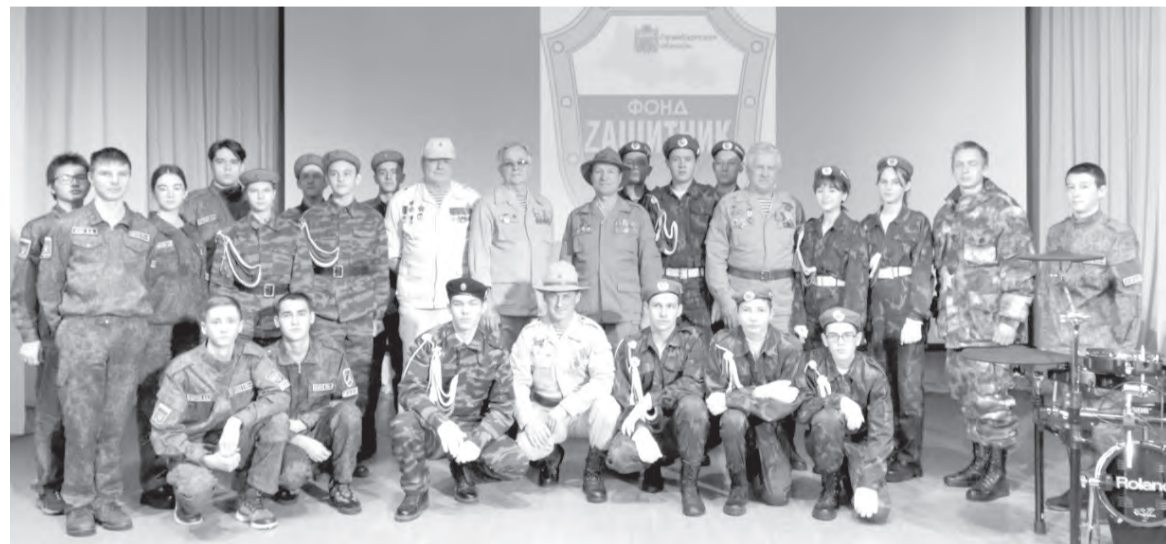
После концерта в Красногвардейском районе