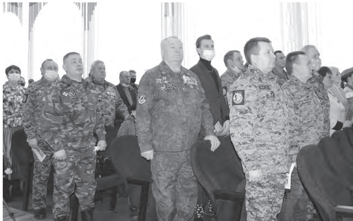
Минута молчания в память погибших товарищей

Смысл организации: объединяться вокруг идеи и памяти о службе. Встречаться с молодёжью, доносить до неё истину. Примеры героизма есть и сейчас, как наш земляк Александр Прохоренко. Это новое поколение бойцов, новая смена защитников. А нам с вами нужно продолжать строить государство, и без участия ветеранов боевых действий оно не обойдётся. Важно сотрудничать, прорабатывать полное взаимопонимание таких общественных организаций и представителей власти.