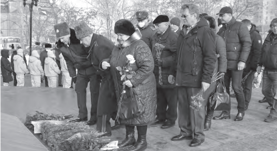
Скорбят матери погибших воинов и их однополчане

Сегодня самому младшему из них уже полвека. Седина в волосах на непокрытых головах, цветы: гвоздики, розы, хризантемы