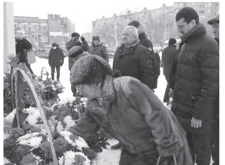
Новотройчане помнят своих земляков-героев