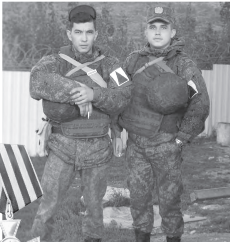
Владимир (справа) с армейским товарищем

«Везунчик и счастливчик», – говорили ему вслед. Но за этими достижениями – каждодневные