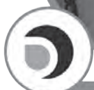
Бионические руки Open Bionics