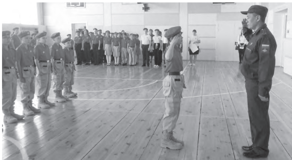
Юнармейцы для выполнения элементов строевой подготовки построены.

– Сегодня в смотре строя и песни приняли участие 14 команд. Могу отметить, что наши юнармейцы повзрослели. Среди выступавших было больше учащихся шестых и