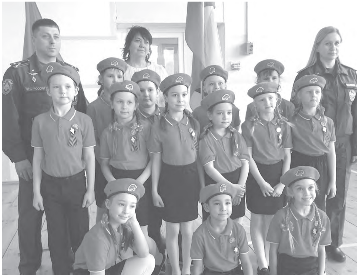
Юнармейцы Павловского лицея – единственные первоклассники на конкурсе.

К конкурсу все команды готовились долго и тщательно. А компетентное жюри, в составе которого были руководители кадетских и юнармейских