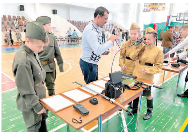
Участники игры знают, как обнаружить и задержать нарушителя границы