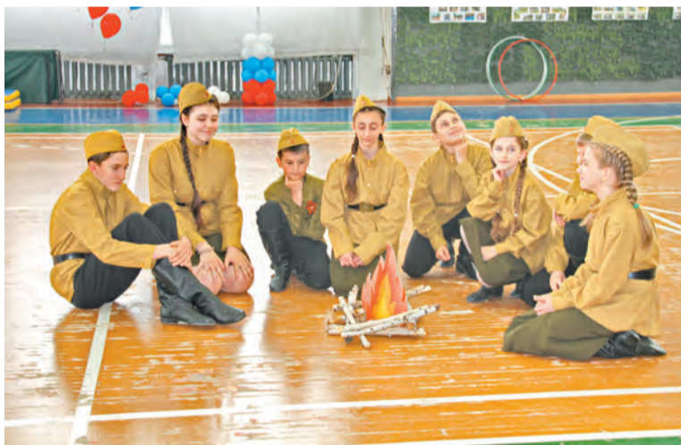
На привале у костра ребята из команды энергетиков

«Дети границы», второе и третье места поделили команды энергетиков.