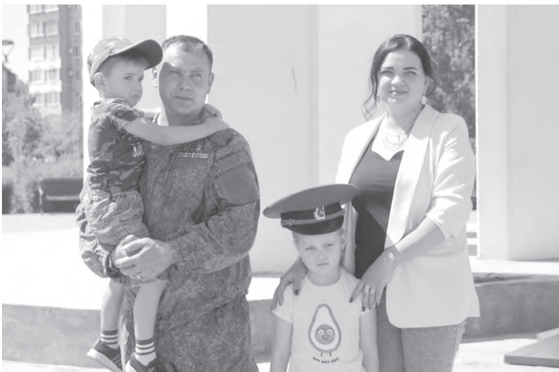
Семья поддерживает своего защитника во всём