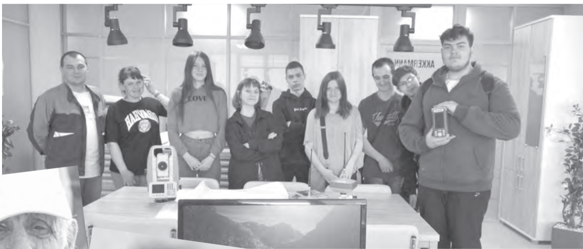
Юные краеведы узнали много интересного на экскурсиях

– В город иногда заглядывали звёзды советской эстрады и театра. Римме Петровне, жене