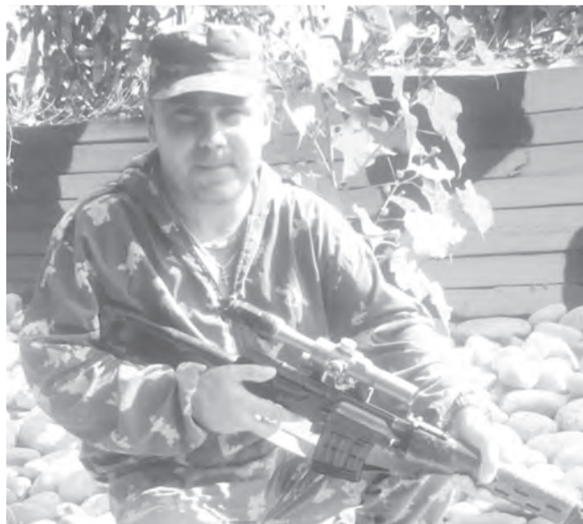
Пограничник всегда верен делу