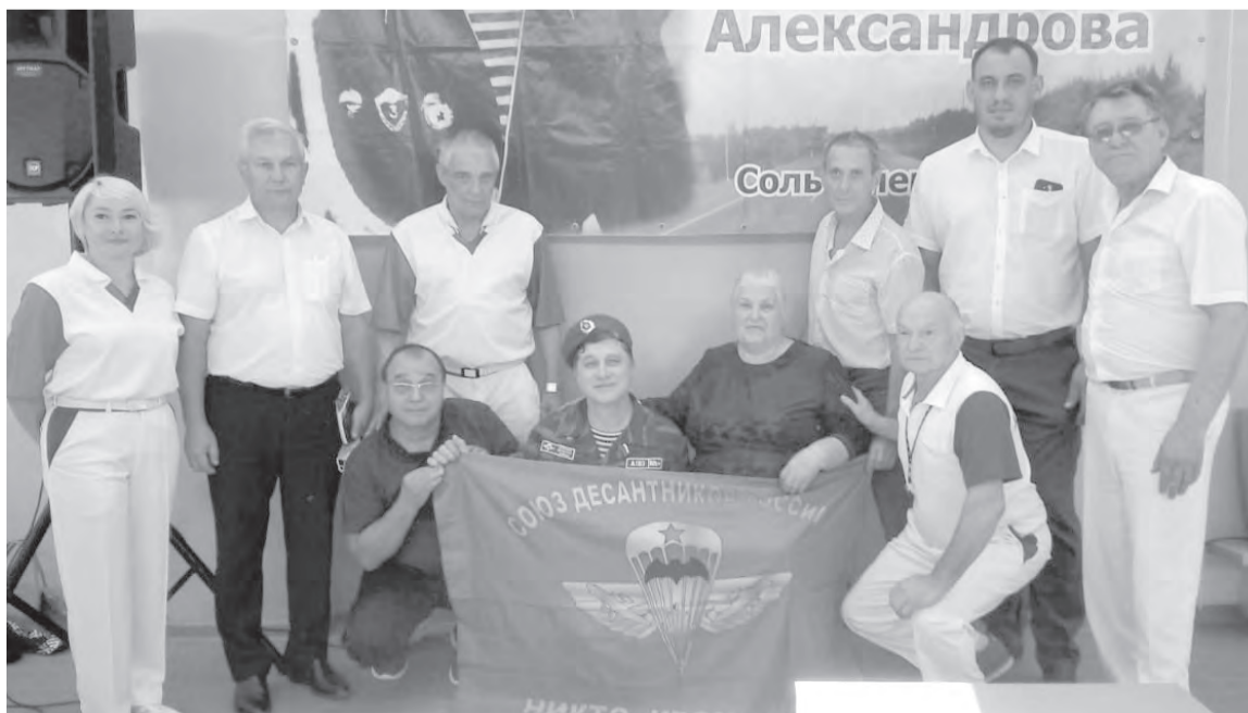
Слова напутствия спортсменам сказали ветераны боевых действий