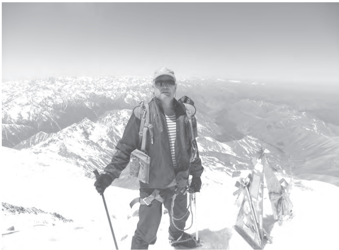
Покоряя горы Эльбруса!

Перенес операцию и лечение в течение трёх месяцев, он вышел из госпиталя на ходулях. Не имея привычки ждать помощи от других, решил заново учиться ходить и не уповать на инвалидность. Много занимался, ходил на сплавы по рекам, любовался красивыми пейзажами вдоль водных артерий Урала, Самары, Нугуша. Пересиливая себя, начал восстанавливаться.