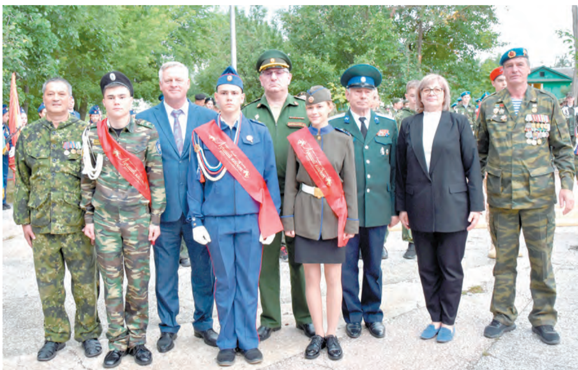
Гости с победителями конкурса «Лучший кадет Оренбургского района – 2023»

По итогам конкурса третье место заняли учащиеся кадетского (казачьего) класса Подгороднепокровской школы. Юные казачата обязательно станут носителями и хранителями казачьих устоев. В этом году ребята заняли второе место на областном фестивале «Служение Отечеству, казачеству и Богу», первое место на всероссийском