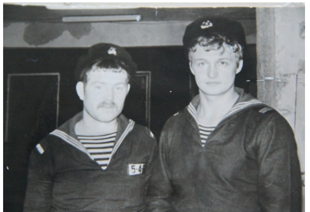
Морское братство закалялось в подлодке