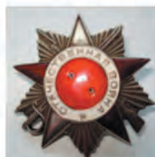
Орден Отечественной войны II степени (1945г.)