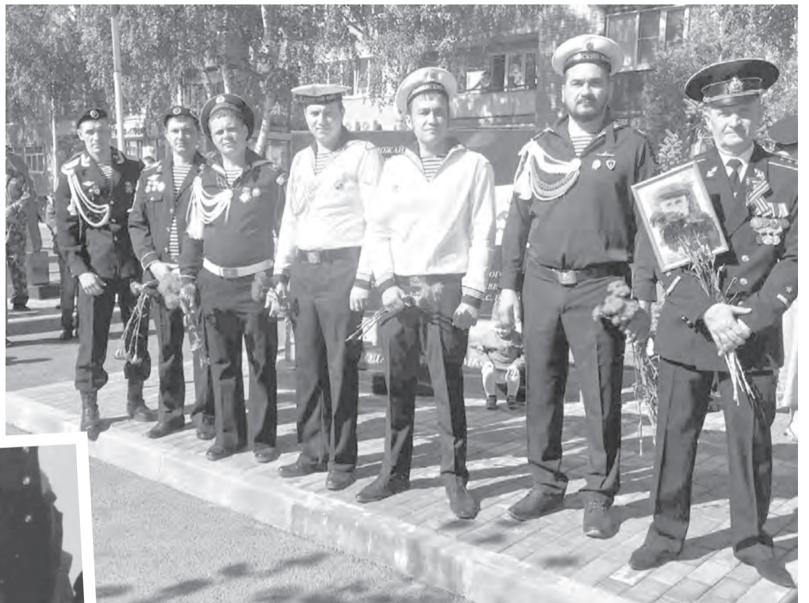
Моряков поздравили пограничники, десантники и жители города

дили ко всем учениям, особенно - по поддержанию жизнеспособности АПЛ. У подводников, у моряков вообще два главных врага - огонь и вода. Поэтому каждый знал, что делать в нестандартных ситуациях, и знал чётко.