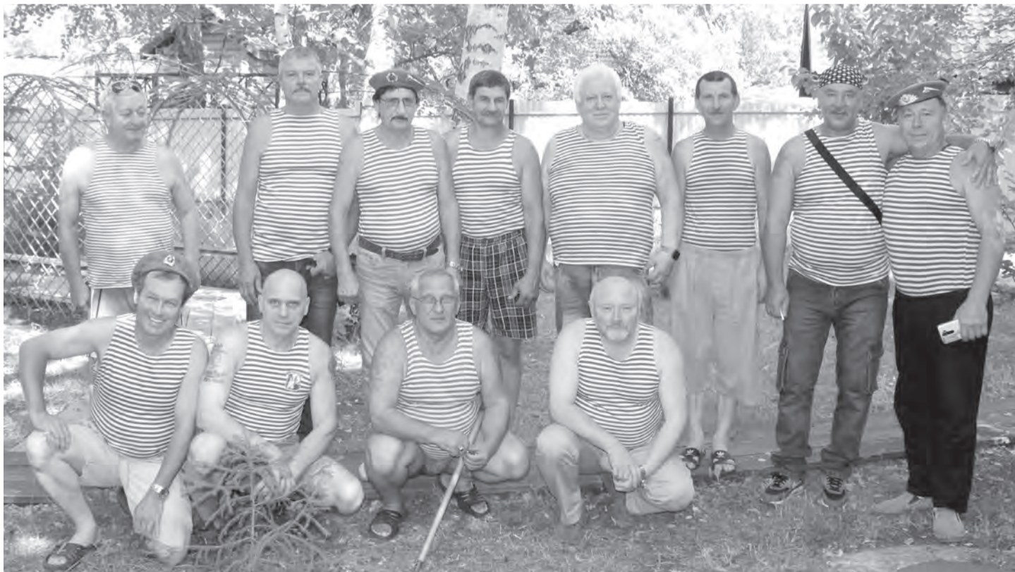
Встреча ветеранов 103-й гвардейской дивизии ВДВ в Бузулуке