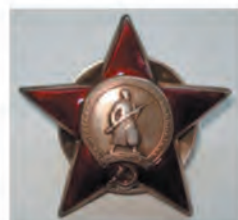
Орден «Красная звезда» (1944г.)