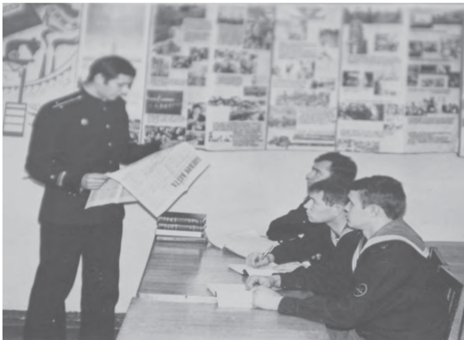
Годы в учебке во Владивостоке навсегда в памяти