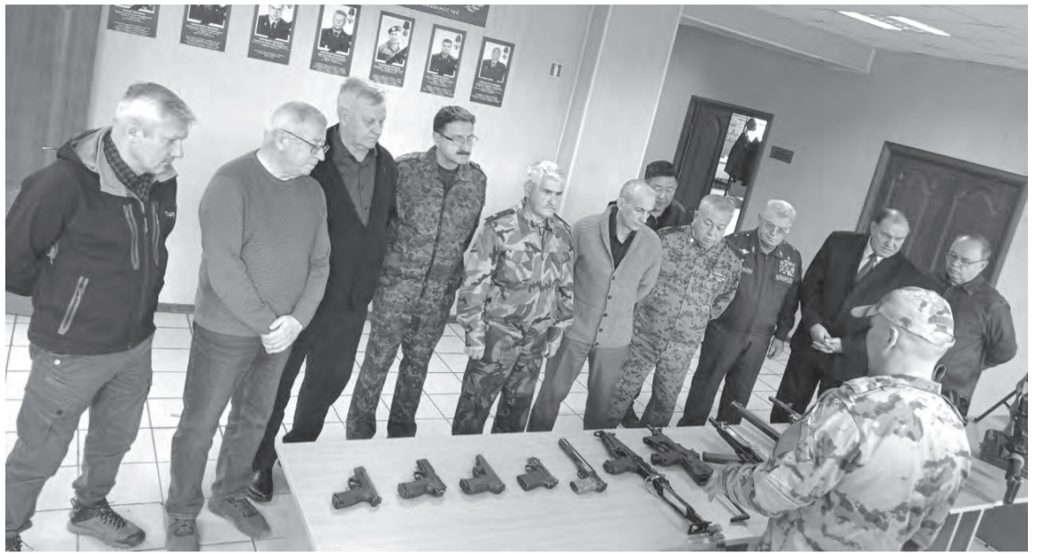
Перед проведением стрельбы сотрудники ОМОН Росгвардии ознакомили прибывших генералов с современными об-

В турнире памяти сотрудников правоохранительных органов, погибших при исполнении служебных обязанностей, приняли участие генералы, служившие в МВД, Пограничной службе и военной контрразведке ФСБ России, ФСИН, Вооружённых Силах, органах наркоконтроля и таможни.