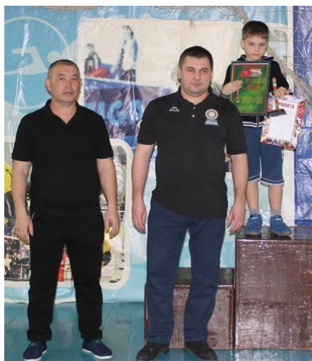
Первый обладатель кубка пограничников