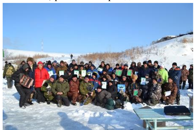
Фото на память.