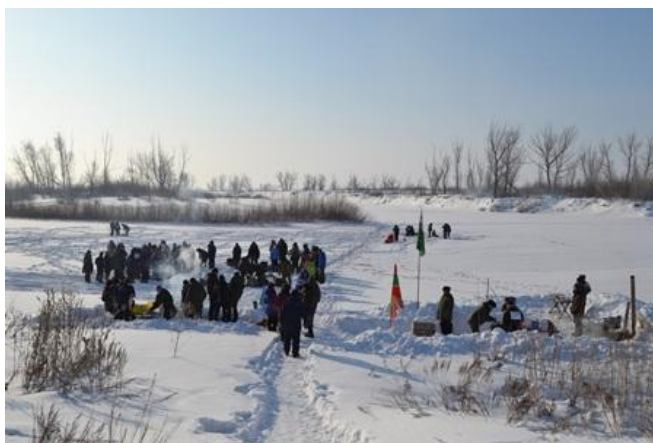
Участники турнира по зимней рыбалке.

Организаторы турнира - кувандыкские ветераны-пограничники - приняли решение сделать турнир по зимней рыбалке традиционным и проводить его ежегодно.