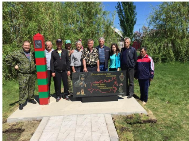
28 мая будет открыт памятный знак в с.Тоцкое

Сразу два памятных знака будут торжественно открыты в г.Оренбурге в сквере около памятника Феликсу Дзержинскому в 19:00 27 мая 2018 года во время проведения культурно-патриотического мероприятия «Боевой расчёт». Один из памятных знаков установлен в честь 100-летия со дня учреждения Пограничной охраны Российской Федерации, а второй в честь 100-летия со дня образования органов государственной безопасности страны (ВЧК - КГБ - ФСБ). В ходе мероприятия можно будет ознакомиться с работами детей, принявших участие в творческих конкурсах, с соблюдением воинских ритуалов пройдет торжественное построение ветеранов-пограничников, открытие памятных знаков, возложение к ним и памятнику «Феликс Дзержинский с детьми» цветов, а также награждение ветеранов юбилейно-памятными медалями.