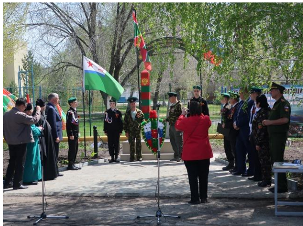
Открытие памятного знака в г.Кувандыке

В период текущей недели ветеранами-пограничниками области запланировано посещение мест захоронений пограничников, погибших при выполнении задач по охране Государственной границы Отечества. В целях увековечения памяти о пограничниках всех поколений и в ознаменование 100-летия со дня учреждения Пограничной охраны Российской Федерации проведены подготовительные работы и планируется открытие памятников (памятных знаков) в г.Соль-Илецке, а также районных центрах Тоцкое, Октябрьское и Ташла. Первая торжественная церемония открытия памятного знака в честь пограничников состоялась 12 мая в г.Кувандыке.